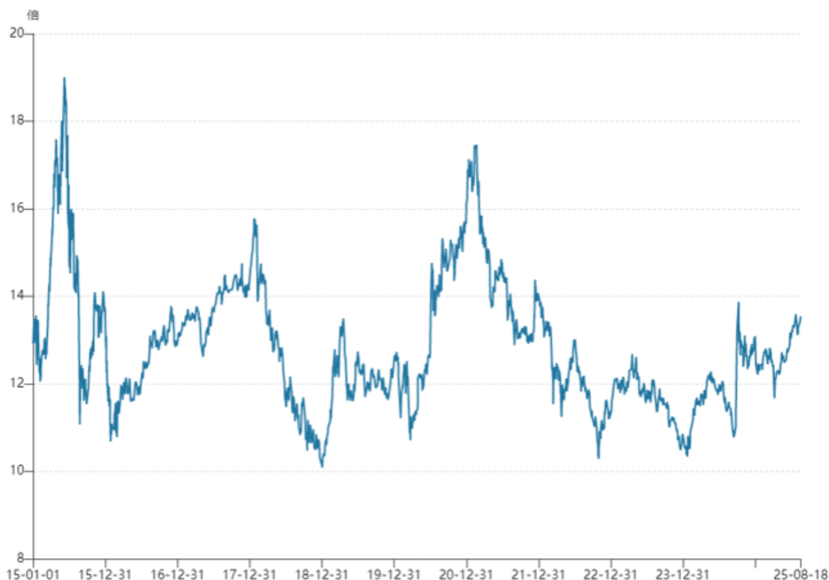
图 1：沪深 300 指数的动态市盈率 数据来源 WIND 华鑫期货研究所

截止 8 月 18 日，WIND 数据显示，沪深 300 指数的 TTM 市盈率 13.8 倍，该数据处于 2015 年 1 月以来的 61.3% 分位，即目前数据在过去十年内 60% 之上，处于略高的位置，但百分位高≠泡沫，2015 年牛市顶峰时，沪深 300 指数动态市盈率曾达 19 倍，2021 年年初达到 17.45 倍，2018 年初也曾达到 15.8 倍，目前沪深 300 指数接近 14 倍只是“脱离便宜区间”，距离危险水位仍有一段距离。