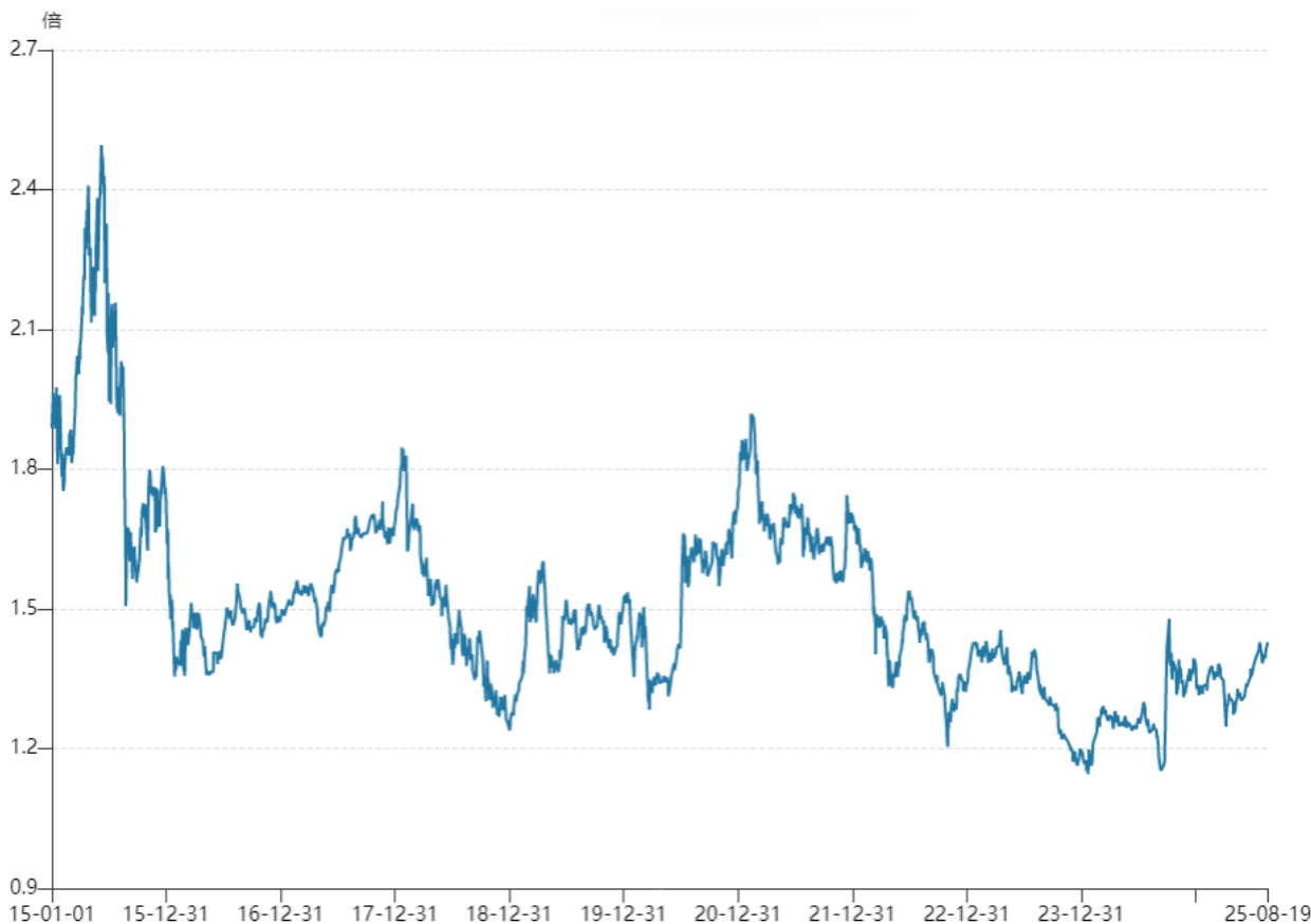
图 2：沪深 300 指数的市净率

目前沪深 300 指数的市净率在 1.47 倍左右，PB 在 2015 年以来的全部交易日中约位于 23.7% 分位，处于历史偏低水平。