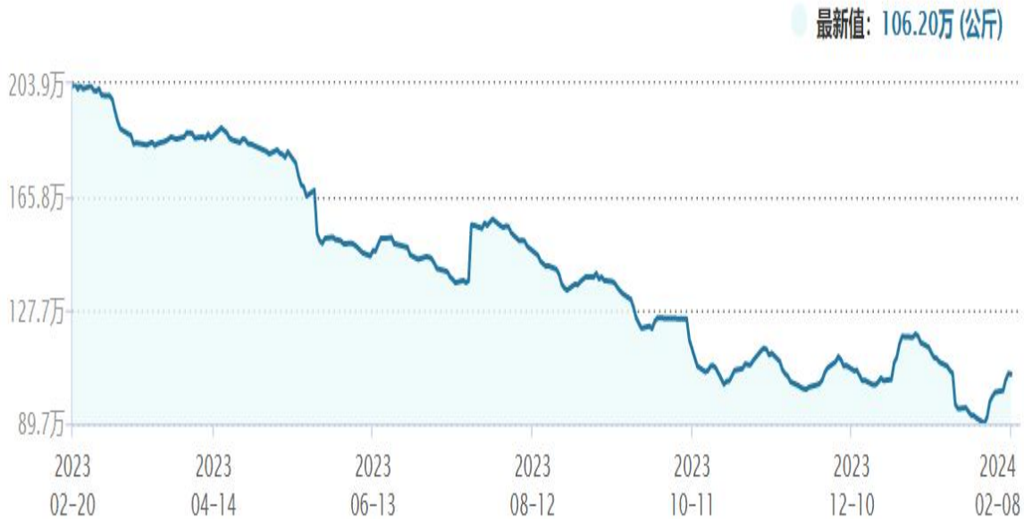
图2 上期所白银库存 数据来源WIND

较去年同期下降50%，上海黄金交易所库存较去年6月初下降了超过40%。而COMEX白银自2021年年初结束长达近十年增库周期后，持续保持去库状态。值得注意的是，墨西哥是全球最大的白银生产国，白银产量在过去两年中下降了近25%。这是近十年来的首次。我们判断，在全球保持降息预期，且“靴子未落地”的背景下，黄金将继续保持高位，回调后依然具备配置优势，同时白银的弹性也有望逐步恢复，这也是基于全球白银库存下降趋势叠加下游需求恢复的背景，且目前金银比价也处于高位。