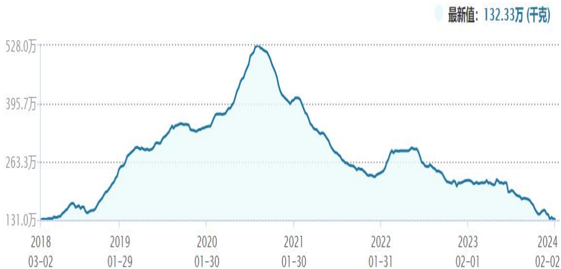
图3 上期所白银库存