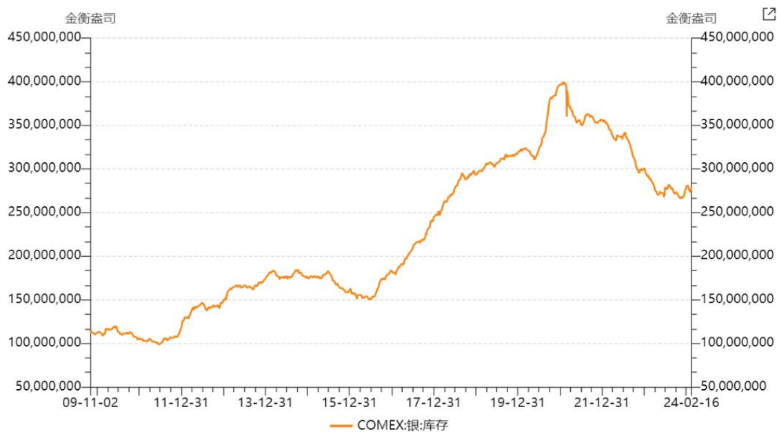
图4: COMEX白银库存